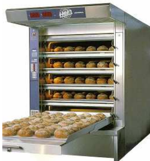
1. Piec rurkowy Hein Universal NOWOCZESNA TECHNIKA W SŁUŻBIE TRADYCJI